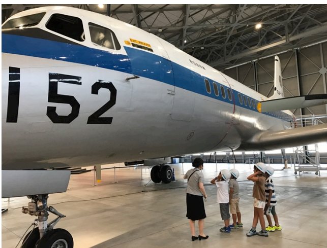
【圖：仔細聽著飛機介紹的小朋友們】

愛知航空博物館於去年底才剛開幕，非常有幸能一探究竟。博物館裡展示上百個飛機小模型，亦有實機介紹、體驗課程等。我們在航空博物館看到許多家長帶著學齡前的小孩來參觀，甚至報名團體的飛機介紹課程，感覺日本真的蠻重視從小就開始「見學」。此外，館內的展區設計也深具美感和教育意義，例如在「飛行體驗」的4D展區，模擬坐在飛機上眺望愛知縣的眾多景色，座椅還會隨著飛機高度與角度的不同而變化，讓我們如臨其境，印象深刻，也不得不佩服日本人精緻和用心的設計態度。