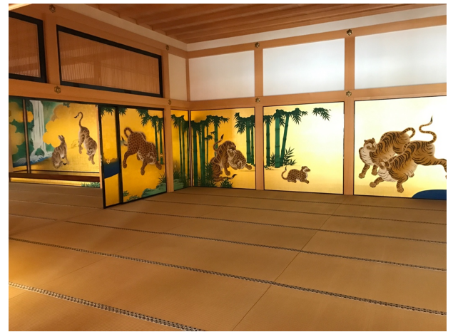
【圖：本丸御殿裡的障壁畫，金碧輝煌】

名古屋城是1600年代德川幕府所建立的城堡，由於指標建築物天守閣正在整修，我們主要參觀將軍的居所本丸御殿。不得不說本丸御殿裡的障壁畫真的精緻又金碧輝煌，但由於當天實在太熱(攝氏38度，據說是名古屋40幾年來最高溫)，很可惜難以好好靜下心來一一欣賞殿裡的壁畫。倒是在戶外看到許多有趣的景象：例如有「忍者」在城裡出沒、還有熱心變魔術的日本爺爺、更遇到了穿著日本傳統婚服的新人，是很不一樣的經驗。