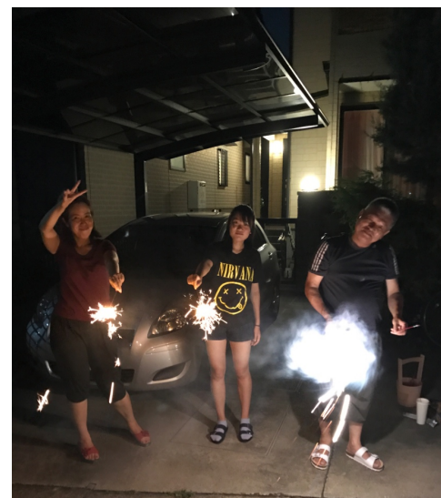
【圖：在家門口前玩煙花】