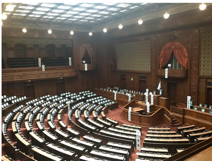
【圖：日本眾議院的會場】

此外，很讓我意外的是整趟參訪竟然是由「警察」為我們導覽，除了勤務工作，他們還精通國會的各種知識和歷史而為遊客作專業的解說，令人讚嘆。