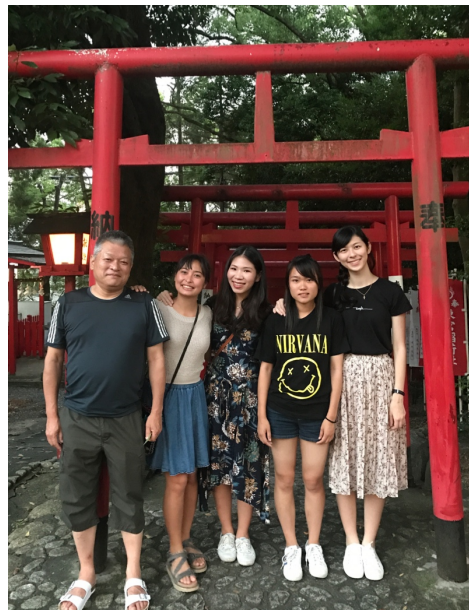
【圖：與寄宿家庭參加神社祭典】