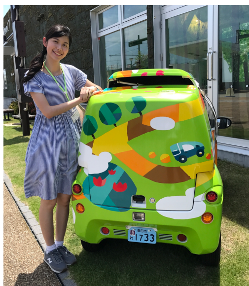
【圖：一輛漆著可愛油漆的共享汽車。汽車的尺寸並不大，底盤亦低，只能剛好「坐」一個人】