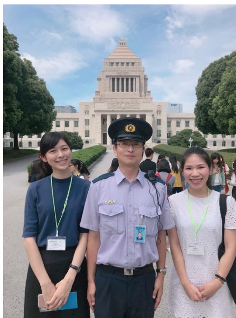
【圖：在國會前與帶我們導覽的警察合影】