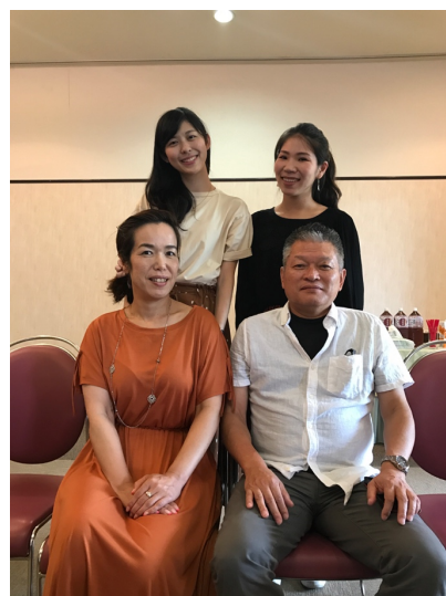
【圖：歡送會與 Home 爸媽合影】