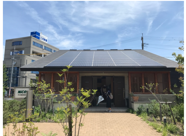
【圖：「森でつながる家」外觀，屋頂上可見太陽能板】

另外我們也參觀了「 與森林連結的房屋 」(森でつながる家)，這棟房屋使用太陽能做為電力來源外，特別的是其 建材主要是來自豐田市境內森林多餘的樹木 ，木材可以維持室內溫度、冬暖夏涼、調節濕度，充分利用大自然的「恩惠」，達到自然、工業與文化共存的效果。