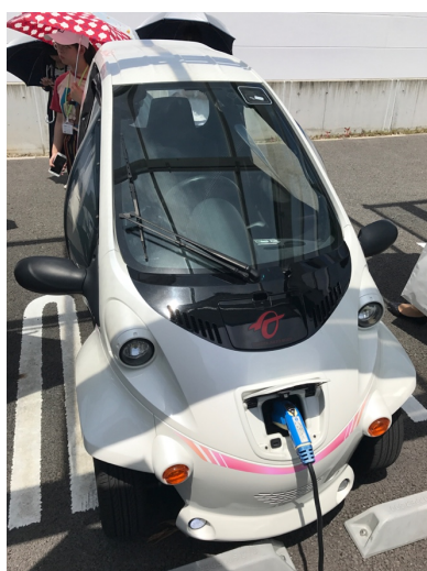
【圖：正在充電的共享汽車】

Ecoful Town 是豐田公司為了描繪「環保低碳社會」的概念而打造出來的一座迷你城市，表達對未來都市的構想。 主展廳裡面展示仿生技術的各種發明，例如：表面有自淨能力的磁磚（模仿蝸牛殼的親水層）、取自植物光合作用靈感的太陽能電池等。展廳外令我最感到新奇的是「 共享汽車 」，在台灣我們共享腳踏車 YouBike，但從沒想過「汽車」也可以共享！車型雖小，但可以遮風避雨，或許在台灣搭計程車不便的地方未來也可以引進這樣的概念。