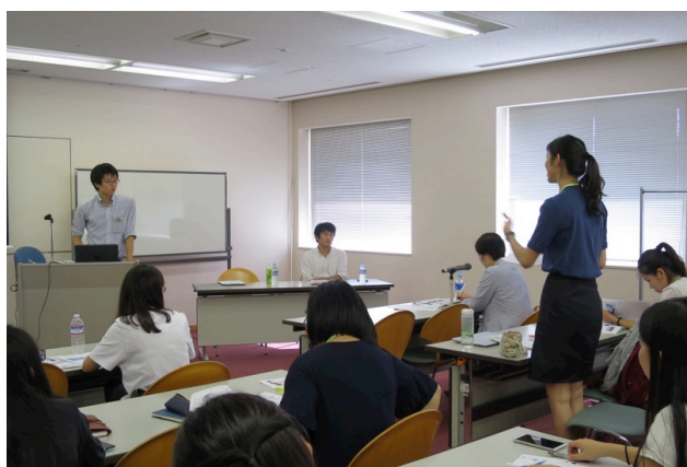
【圖：於愛知縣產業發展講座發問】

這場講座由愛知縣勞動部振興科的官員與我們分享愛知縣機器人、航空業的發展。其中提到愛知縣之所以航空工業發達，除了因地理位置（飛機零件體積龐大，通常是利用海運、空運，而愛知縣除了有機場、亦有港口，向海外出口方便。），更多的是因為歷史因素。1960年代因三菱重工(Mitsubishi)選在愛知縣生產戰鬥機，培養了許多生產飛機的人才。這讓我想到因豐田汽車(Toyota)當初選在愛知縣的舉母市生產汽車，也使得整個縣的汽車業蓬勃發展，舉母市更因此改名為「豐田市」。相較而言，台灣以中小型企業為主，因此我們很難想像一個縣市可以因為一個公司而繁榮、甚至帶動整個城市的產業發展，對我來說這是一個很不一樣的看見。