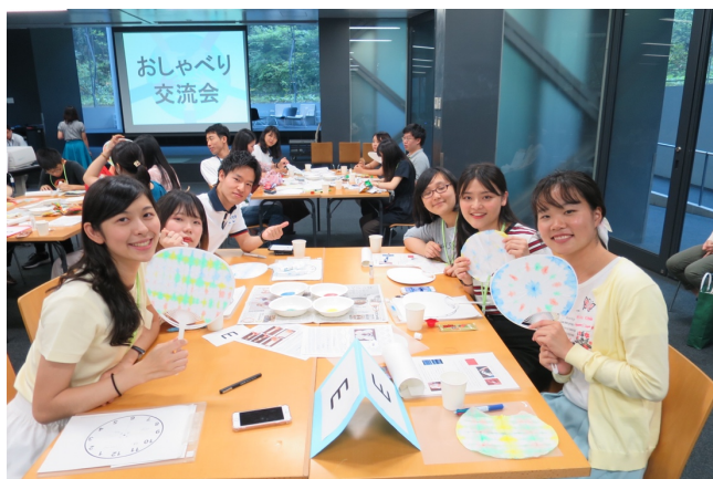
【圖：與名古屋大學生一起製作紮染扇子】

在交流會中，籌辦的名大同學非常用心的設計破冰遊戲、勞作與小組分享的時間。在勞作時間， 我們一起製作愛知縣著名的「紮染」，並做成圓扇。 為了讓彼此多瞭解，主辦安排的討論題目是 分享「希望十年後的自己成為什麼樣的人」。 在過程中不僅讓我們去思考自己的未來，同時和初次見面的朋友們也能夠談深入的話題，是很有意義的活動。若每組能有更多的日本學生就更好了！由於我們拜訪的時間適逢日本的大學期末考時期，據說名大的學生還花了一個多月的時間籌備，非常感謝他們的用心。